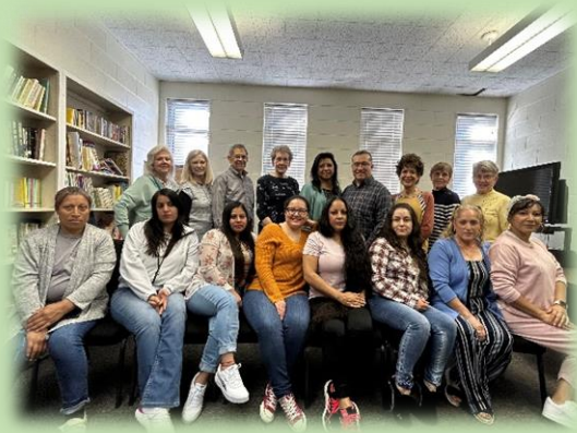
Some of morning teachers and students

We are grateful to God for His faithfulness in this four years of our ESL program. Students in both shifts continue learning and improving their English. Some of them have been very committed since our start in 2019. A big thanks to our volunteer teachers and all of those who have been supported this ministry in many ways. All honor and glory to our Heavenly Father!