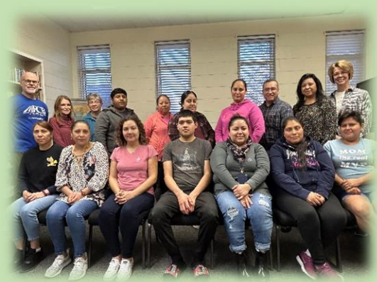
Some of the evening teachers and students