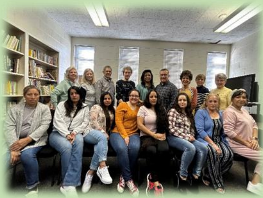
maestros y estudiantes del turno matutino

En este mes, el programa de Inglés como Segundo Idioma ha cumplido cuatro años. Los estudiantes de los dos turnos siguen aprendiendo y mejorando en su inglés. Gracias a nuestros maestros voluntarios y todos aquellos que han apoyado este ministerio de diferentes maneras. ¡Gloria y honra a nuestro Padre Celestial!